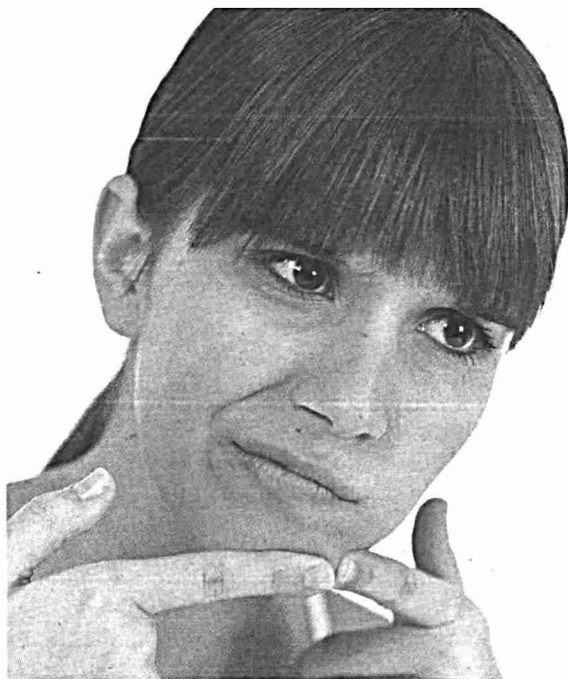
Los científicos encontraron una relación entre un aumento de pensamientos suicidas y jóvenes con acné severo y moderado.